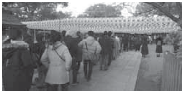
鳥居外まで続く参拝者の行列

令和初のお正月を迎え、天候にも恵まれ、参拝者は大幅に増加した。ご遺族崇敬者ご奉納の境内一面に飾られた神前献灯二〇〇〇灯の下には、鳥居の外まで参拝者の列が絶え間なく続いた。ご高齢のご遺族が奉納された提燈の場所を、孫やひ孫の方と探されるほほえましい姿があちこちで見られた。昨年の改元以来、ご朱印を求め参拝者が激増しているが、お正月も朱印帳を片手に新年参拝をされる姿があふれた。