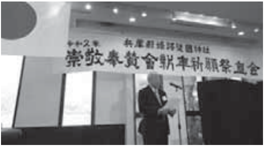
三宅会長のご挨拶