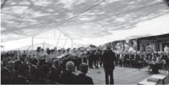
姫路市民合唱団による合唱奉納