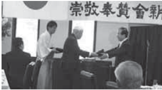
お祝いの品を受けとる釜谷副会長