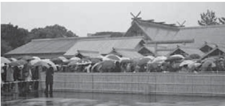
大嘗宮見学の様子