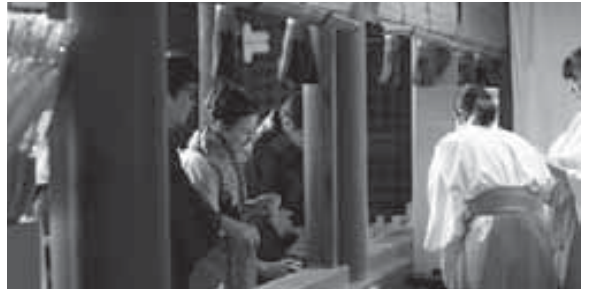
着物でおみくじをひく外国人